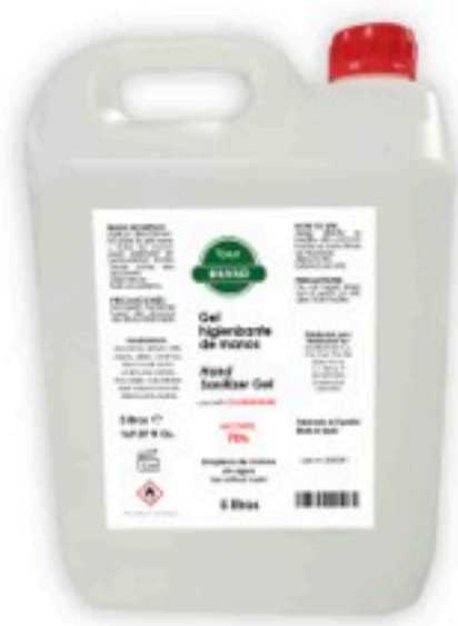
Formato: 5 litros

INGREDIENTES: 70 % ALCOHOL DENAT, AQUA, UREA, ACRYLATES/C10-30 ALKYL ACRYLATE CROSSPOLYMER, CHLORHEXIDINE DIGLUCO