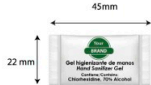
Formato: 1 ml (en breve) una caja 1.000 sticks