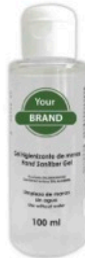
Formato: 100 ml Pedido mínimo con marca propia: 40 cajas 54 botellas/caja