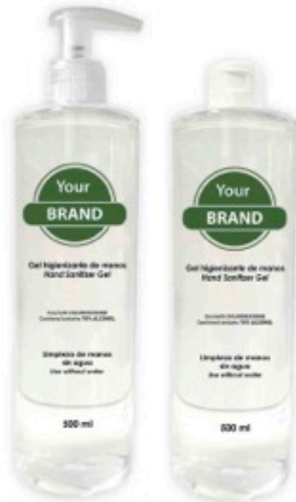
Formato: 500 ml Pedido mínimo con marca propia: 20 cajas 27 botellas/caja